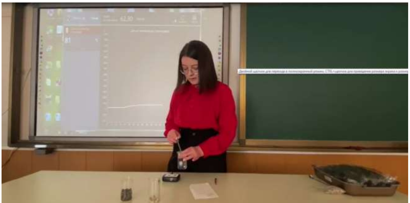
Измеряем температуру воды, которой будем заливать субстрат, 81