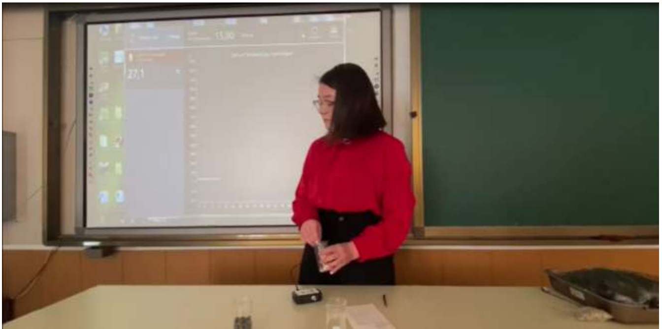
Измеряем температуру мицелия 27