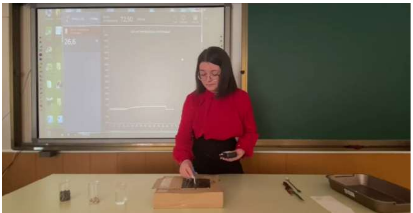
Измеряем температуру смеси 26